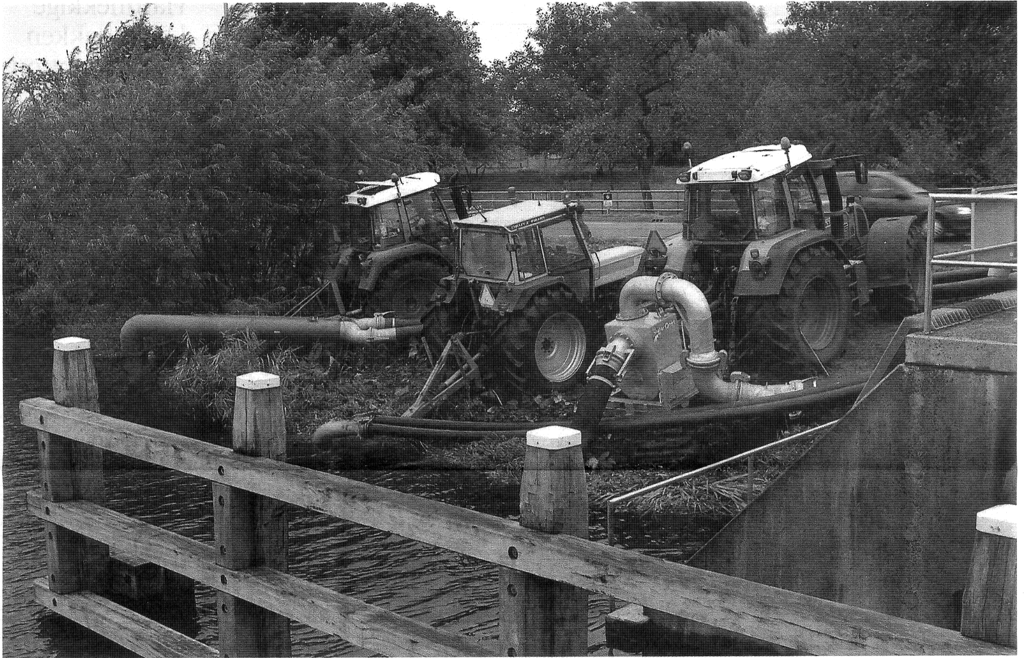
Stoer: tractoren drijven de pompen aan bij het Hilversums Kanaal.

1945. De Duitsers hebben de Horstermeer toen onder water gezet.” Een ander ijkpunt is de zomer van 1987. Toen was er in juli een enorme wolkbreuk die de polder binnen korte tijd voor een deel blank deed staan. Dat was ook zondagmiddag weer het angstbeeld. Het bleef maar regenen en het waterpeil bleef maar stijgen. „Mijn peilstok is bijna helemaal onder water komen te staan.”