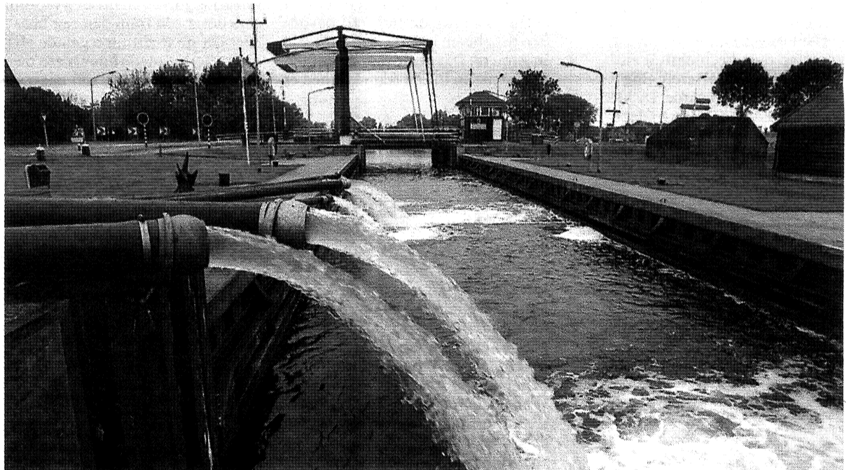
Bij sluis 't Hemeltje wordt al sinds zondagavond gepompt.